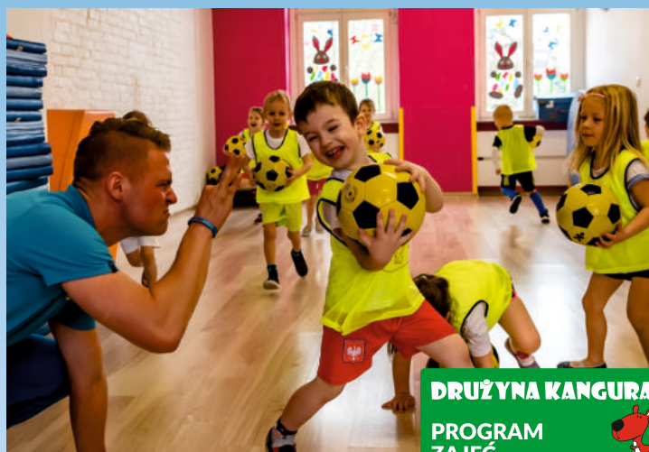
DRUŻYNA KANGURA PROGRAM ZAJĘĆ