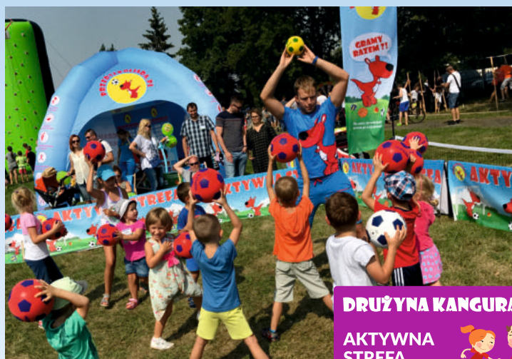
DRUŻYNA KANGURA AKTYWNA STREFA