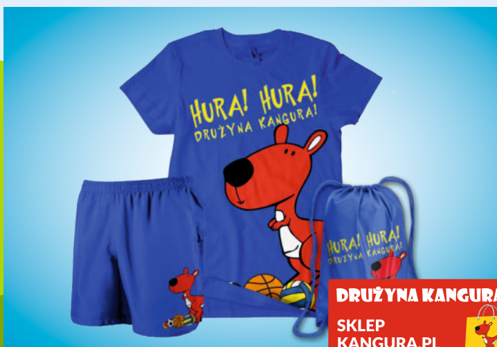
DRUŻYNA KANGURA SKLEP KANGURA.PL