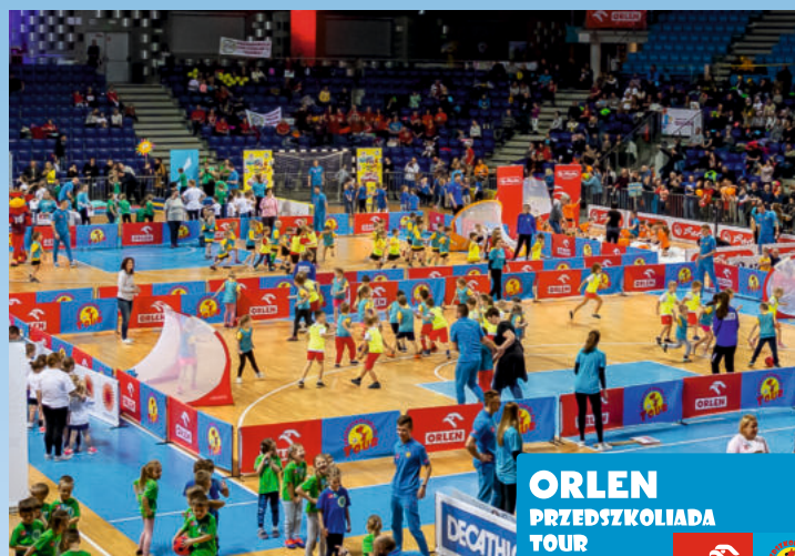
ORLEN PRZEDSZKOLIADA TOUR