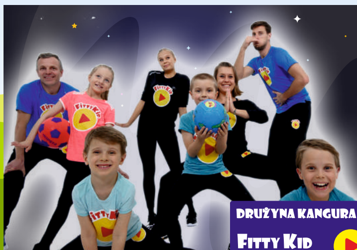
DRUŻYNA KANGURA FITTY KID