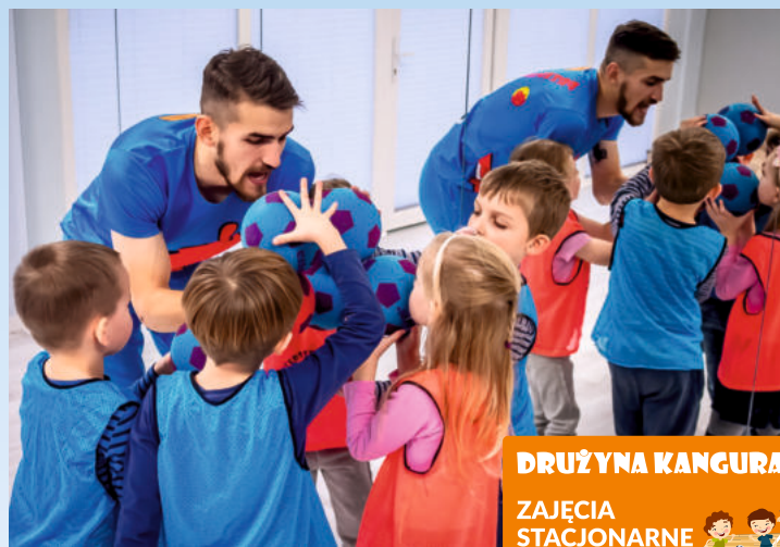
DRUŻYNA KANGURA ZAJĘCIA STACJONARNE