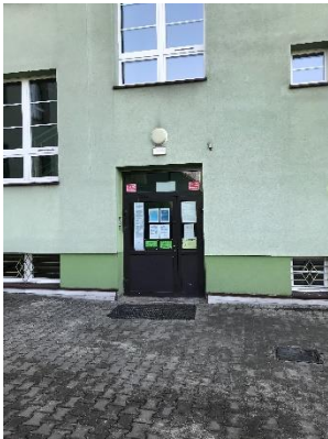
Rysunek 5 Wejście od dziedzińca szkoły