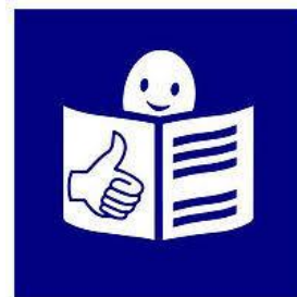
Rysunek 1 Logo tekstu łatwego do czytania i rozumienia

Informacje o Miejskiej Szkole Podstawowej z Oddziałami Integracyjnymi nr 2 im. Karola Miarki w Knurowie w języku łatwym do czytania – ETR (easy to read)