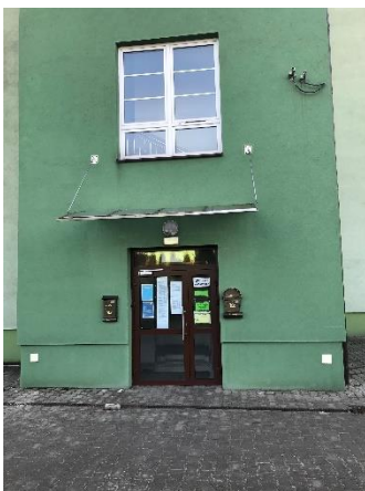
Rysunek 6 Wejście do windy