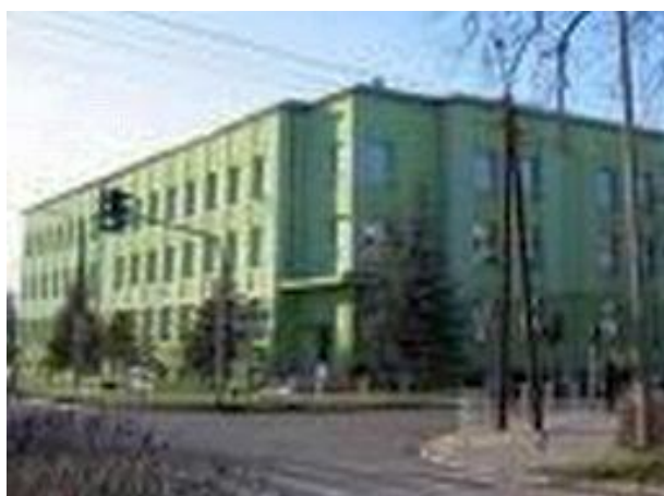
Rysunek 2 Budynek szkoły, widok ze skrzyżowania ulic Szpitalnej i Wilsona

Miejska Szkoła Podstawowa z Oddziałami Integracyjnymi nr 2 im. Karola Miarki w Knurowie, czyli w skrócie Msp2 znajduje się przy ulicy Wilsona 22 w Knurowie.