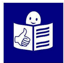
Rysunek 8 Logo tekstu łatwego do czytania i rozumienia

strona internetowa szkoły: https://mSP2knurow.edupage.org/