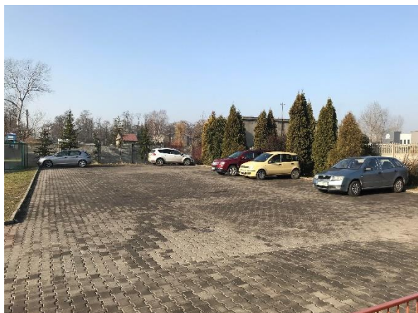
Rysunek 7 Parking dla osób przyjeżdżających do szkoły

Przed bramą wjazdową do szkoły znajduje się parking dla rodziców i innych osób odwiedzających szkołę.