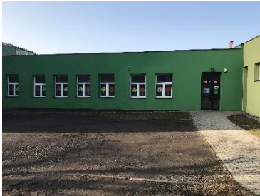
Rysunek 4 Wejście do szkoły od ulicy Szpitalnej